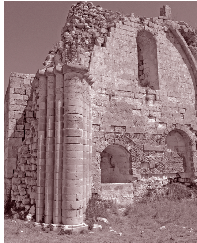
Das Kloster San Nicola di Casole in Salento, Apulien: In diesem süditalienischen Gebiet wurde das Etymologicum Gudianum verbreitet. // The monastery San Nicola di Casole (Salento, Apulia): this region of Southern Italy was a main area of diffusion for the Etymologicum Gudianum . ②

The rich production and use of the corresponding manuscripts characterised by their multi-layered texts and later additions will be studied thoroughly. Thus, the cultural environment that created and disseminated these manuscripts can be analysed to determine their role as repositories and vehicles of knowledge.