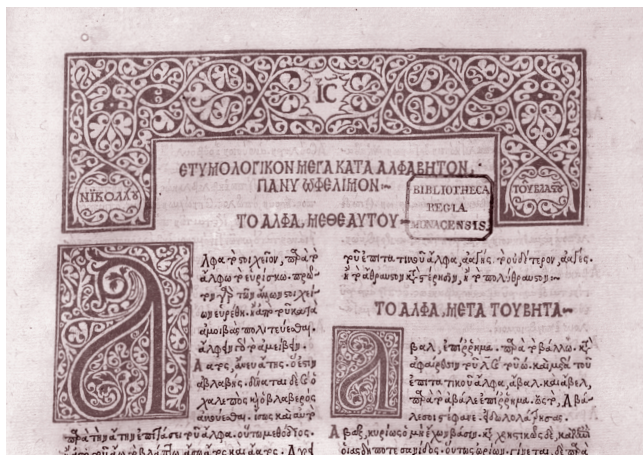
Anfang der Erstaussgabe des Etymologicum Magnum (Detail), welches das Etymologicum Gudianum als Quelle benutzt hat. // Beginning of the first printed edition of the Etymologicum Magnum (detail), which used the Etymologicum Gudianum as a source. ①

Order and interpretation of knowledge in Greek and Byzantine lexica up into the Renaissance. Online edition with resources on manuscript production, user groups and cultural environment