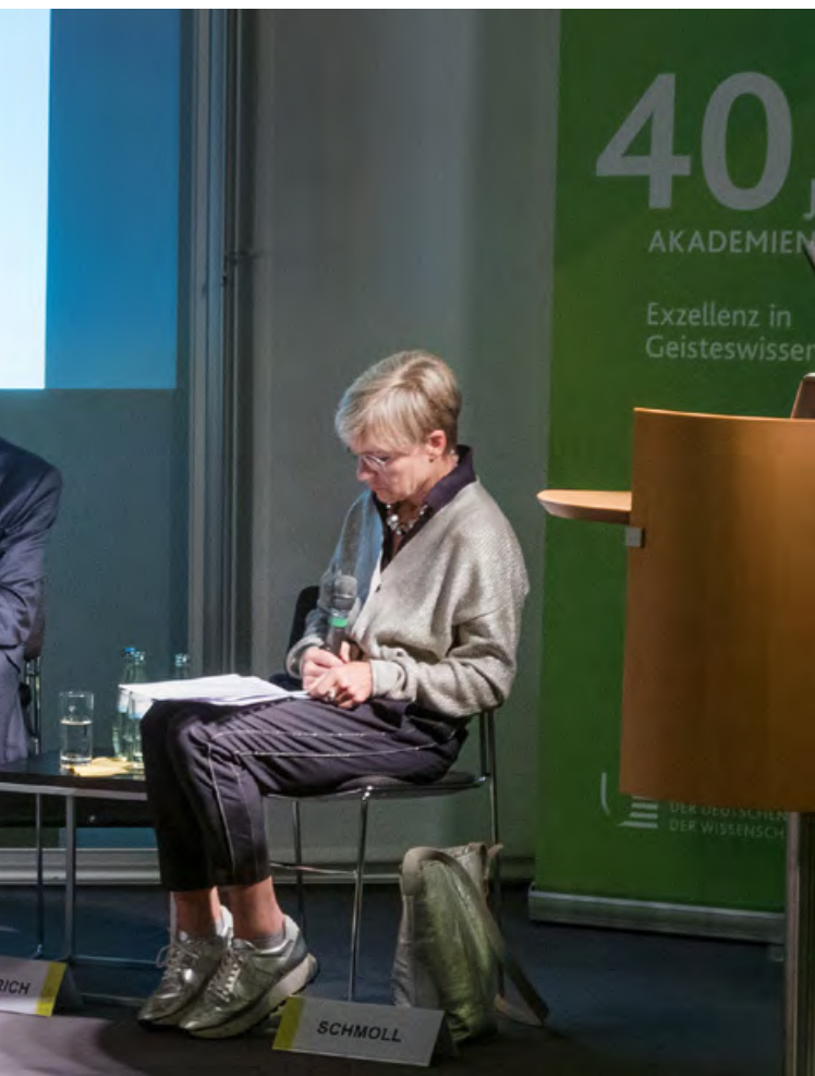
Diskussionsveranstaltung „Bewährt, lebendig, vernetzt – 40 Jahre Langzeitforschung im Akademienprogramm“, Hamburg 2019

ist es, gemeinsame Betätigungsfelder zu erkennen und Erkenntnisse aus der Forschung für ökonomisches Handeln fruchtbar zu machen – zum Beispiel mit Podiumsdiskussionen zu Künstlicher Intelligenz, Energieeffizienz oder Hirnforschung.