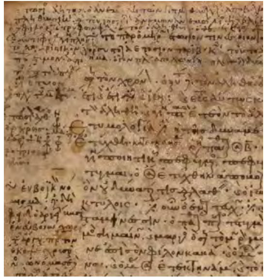
Die Quelle: „Etymologicum Gudianum“

„Eine Gruppe von Gelehrten im späten 10. Jahrhundert arbeitete gemeinsam an diesem Text und Manuskript, um es mit Material aus anderen Quellen zu erweitern und ein neues etymologisches Lexikon zur Erklärung und Vergegenwärtigung der griechischen Sprache zu erstellen.“